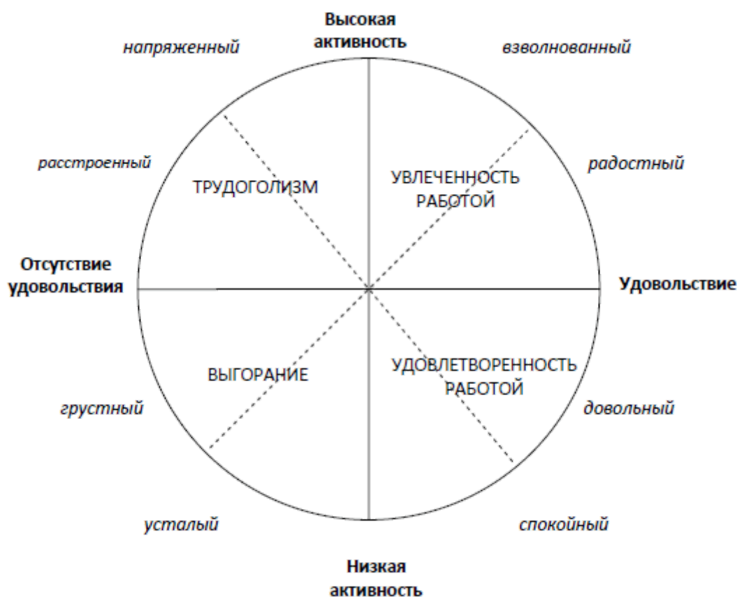
Рис. 2. Типы субъективного профессионального благополучия (Источник: [Bakker, Oerlemans, 2011]).

Классификация типов субъективного профессионального благополучия Арнольда Бейкера (Arnold Bakker) также может служить примером часто цитируемого в зарубежных научных публикациях подхода к выделению типов субъективного благополучия в профессиональной деятельности. Автор предлагает выделять следующие типы благополучия: увлеченность работой, удовлетворенность работой, выгорание, и тудоголизм [Bakker, Oerlemans, 2011]. Предложенная классификация типов (рис. 2) также представляет собой модификацию модели Дж.Рассела и основана на двух критериях: 1) уровень удовлетворенности работой, полюсы оси представлены такими характеристиками, как «удовольствие» и «отсутствие удовольствия»; 2) уровень активности, демонстрируемой человеком в профессиональной деятельности, полюсы оси – высокая и низкая активность.